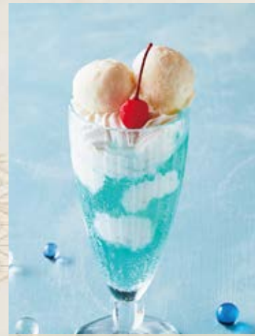
モコモコアイスの空庭ピーチソーダ Mokomoko Ice Peach Soda ¥600