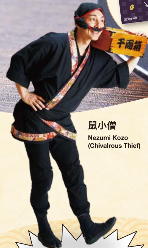
鼠小僧 Nezumi Kozo (Chivalrous Thief)