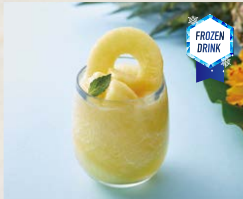
パインのフローズンソーダ Pineapple Frozen Soda ¥650