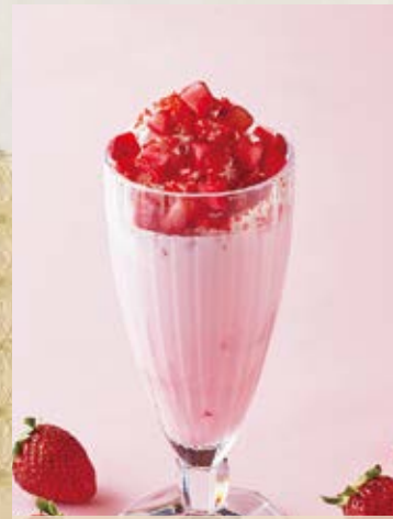
ストロベリーミルク Strawberry Milk ¥700