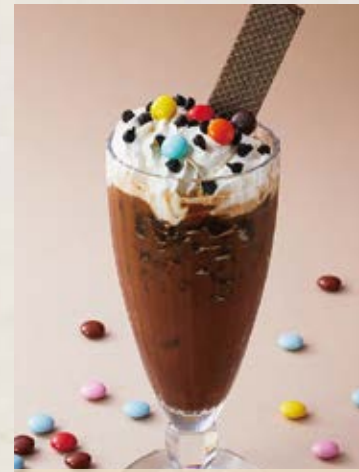
カフェモカ Café Mocha ¥700