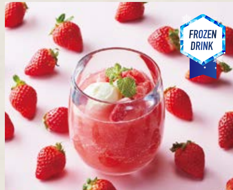
いちごのフローズンソーダ Strawberry Frozen Soda ¥650