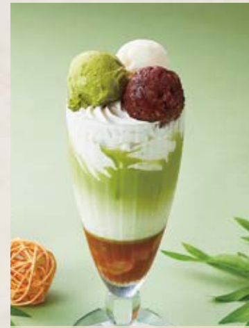
抹茶キャラメル Matcha Caramel ¥700