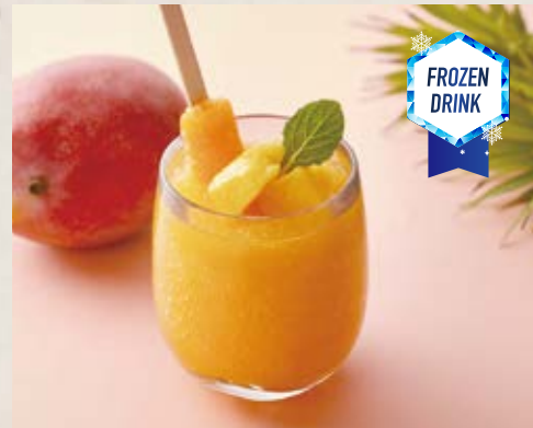
マンゴーのフローズンソーダ Mango Frozen Soda ¥650