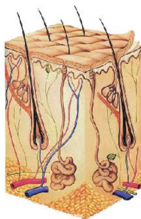
- 皮膚の断面図 -

「皮膚理論」「解剖生理学」などに基づく肌の健康を研究し、医学的アドバイスも得て、あかすりを根本から見直して開発した日本発信の健康美容法。美と健康のエキスパートとして、健やかなトータルビューティーを追及しています。