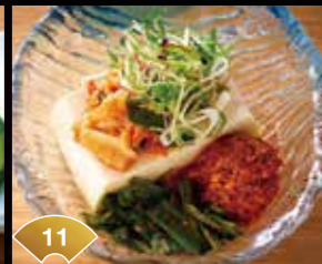
11 매콤한 고기된장이 맛있다 수제 고기 된장 김치 냉두부 Exquisite Sweet and Spicy Meat and Miso Sauce Kimchi and Chilled Tofu with Meat and Miso Sauce ¥400