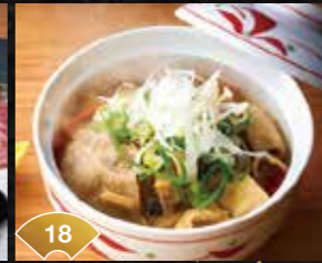
18 육수와 재료의 감칠맛이 녹아든 훈훈한 한 그릇 건더기가 듬뿍 든지루(생시치미 포함) A Heart-Warming Dish Blending Soup Steaks and the Flavor of the Ingredients Hearty Pork and Miso Stew (with Fresh Seasonings) ¥400