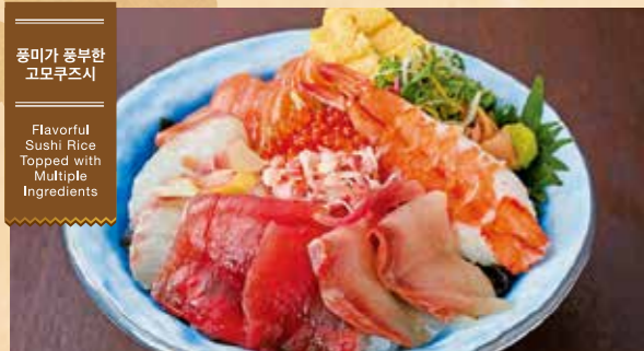
풍미가 풍부한 고모쿠즈시 Flavorful Sushi Rice Topped with Multiple Ingredients

54 단맛이 나는 대개의 감칠맛을 듬뿍 대게 지라시 초밥 (된장국 포함) Filled with the Flavor of Sweet Snow Crab Snow Crab Chirashizushi (includes miso soup) ¥3,000