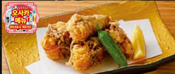
05 겉은 바삭 속은 말랑말랑 복어 튀김 Crispy & Soft Deep-Fried Blowfish ¥1,200