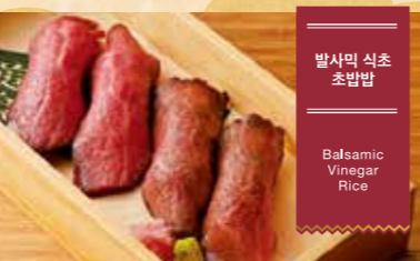
발사믹 식초 초밥밥 Balsamic Vinegar Rice

58 태평양 참다랑어 초밥 (지방, 중간 지방, 살코기) 참다랑어 오토로 주토로 아카미 초밥 Pacific Bluefin Tuna Sushi (Fatty, Medium-Fatty, and Lean) Ultimate Sushi Tasting! Hon-Maguro Sushi ¥1,500