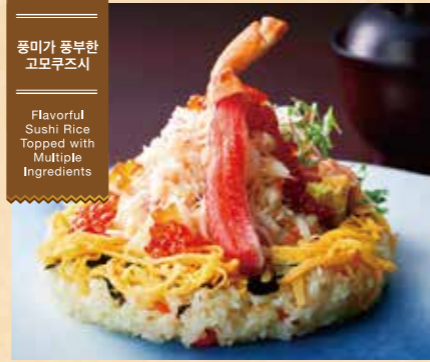
풍미가 풍부한 고모쿠즈시 Flavorful Sushi Rice Topped with Multiple Ingredients

53 신선한 노르웨이 연어, 입에서 살살 녹는다 연어 아보카도 덮밥 (된장국 포함) Fresh Norwegian salmon, melts in your mouth Salmon and Avocado Rice Bowl (includes miso soup) ¥1,400