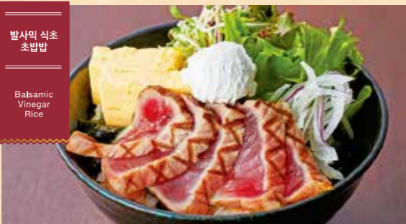
발사믹 식초 초밥밥 Balsamic Vinegar Rice

55 해산물을 듬뿍 담았습니다 호화로운 해물 덮밥 (된장국 포함) An Abundance of Seafood Special Seafood Rice Bowl (includes miso soup) ¥3,300