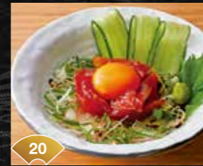
20 참치×참마, 절묘한 밸런스 참치 참마 육회 The Perfect Balance of Tuna and Yam Sauce are the Keys! Tuna and Yam Yukhoe ¥700