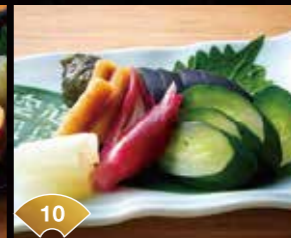
10 각각 소재의 맛을 즐길 수 있습니다 채소 절임 모듬 Enjoy the Delicious Flavor of Each Type Pickle Assortment ¥600