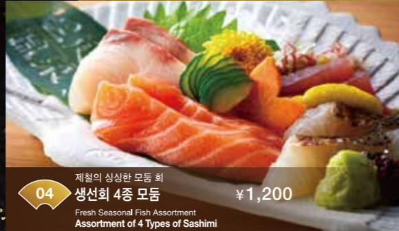
04 재철의 싱싱한 모듬 회 생선회 4종 모듬 Fresh Seasonal Fish Assortment Assortment of 4 Types of Sashimi ¥1,200