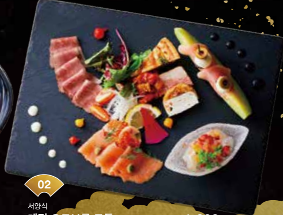
02 서양식 계절 오드브루 모듬 Continental-style Seasonal Hors d'oeuvres Assortment ¥1,600