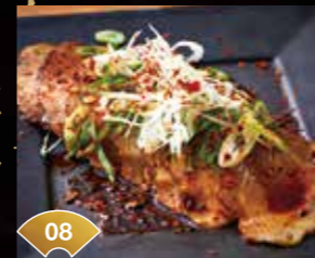
08 저온 조리로 촉촉하게 대만 마라 소스의 구운 파 차슈 Tender and moist with low-temp cooking Grilled Green Onion Char Siu with Taiwanese Mala Sauce ¥500