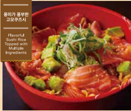
풍미가 풍부한 고모쿠즈시 Flavorful Sushi Rice Topped with Multiple Ingredients

53 신선한 노르웨이 연어, 입에서 살살 녹는다 연어 아보카도 덮밥 (된장국 포함) Fresh Norwegian salmon, melts in your mouth Salmon and Avocado Rice Bowl (includes miso soup) ¥1,400