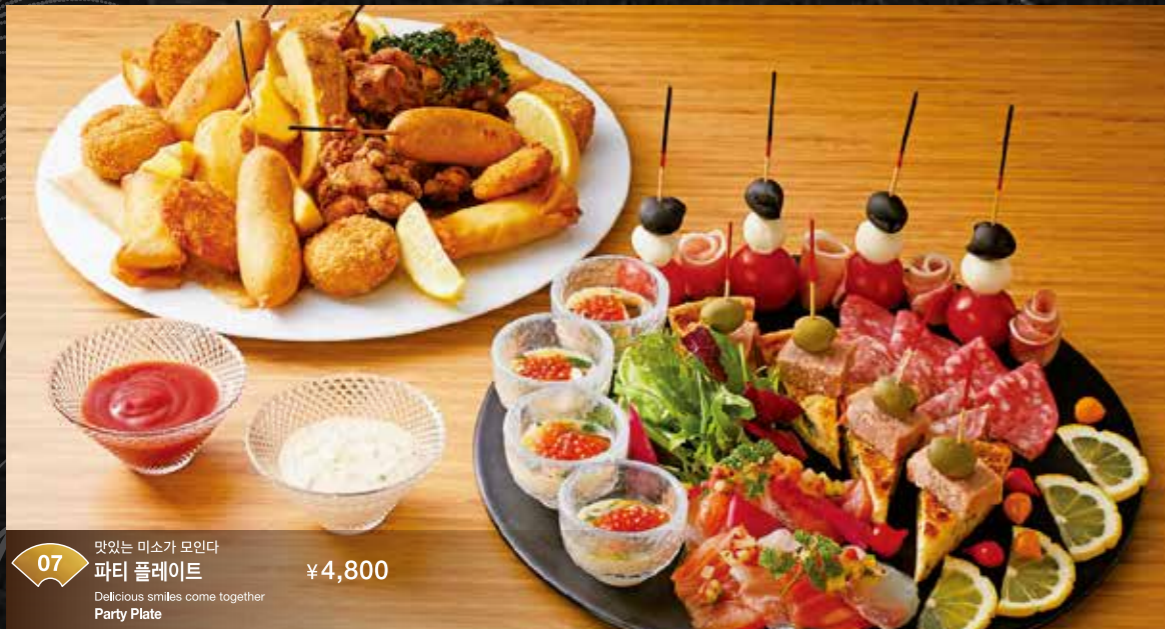
07 맛있는 미소가 모인다 파티 플레이트 Delicious smiles come together Party Plate ¥4,800