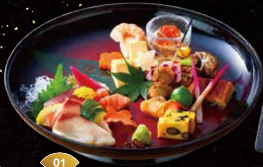
01 일본식 계절 전채 모듬 Japanese-style Seasonal Appetizer Assortment ¥1,600