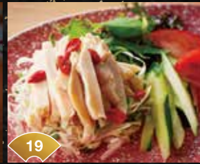
19 깨소스를 듬뿍 뿌려서 매콤한 방방지 Enjoy with a plenty of Sesame Sauce Spicy Bang Bang Chicken ¥500