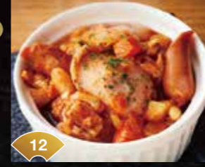
12 야채의 감칠맛이 듬뿍 소시지 포토프 Full of Delicious Vegetable Flavor Sausage Pot-au-feu ¥700