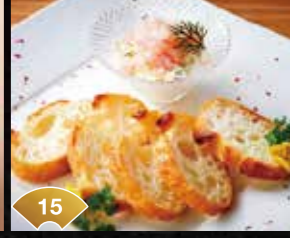
15 프르마주블랑이 결정타 대게와 단새우 카나페 The Fromage Blanc is the Key Snow Crab and Sweet Shrimp Canape ¥700