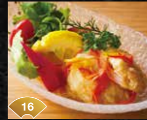
16 마리네이드 소스 맛이 최고! 계절 해산물 에스카베체 Outstandingly Delicious Marinade Sauce Escabeche of Seasonal Seafood ¥600