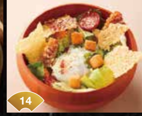
14 반숙 계란이 부드럽게 흐른다 바삭한 베이컨과 반숙 달걀의 시저 샐러드 Caesar Salad with Crispy Bacon and Soft-boiled Egg ¥500