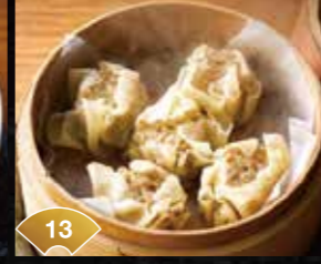
13 한입에 감칠맛이 퍼집니다 슈마이 5개 Delicious Flavor in Every Bite Dumplings (5pcs) ¥500