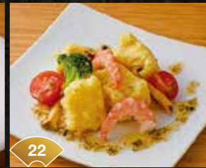
22 바삭 & 사르르 까망베르 튀김 새우와 버섯 의 감바스 소스 Crispy and Creamy Camembert cheese Tempura, Shrimp, and Mushrooms in Ajillo Sauce ¥1,000