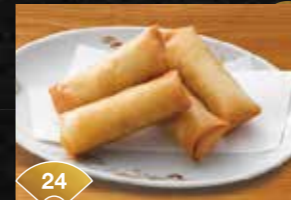
24 바삭바삭함*식감 춘권 4개 Crispy Texture Spring Rolls (4pcs) ¥500