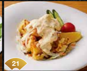
21 단식초와 타르타르가 관건! 소라니와 치킨난반 The Sweet Vinegar and Tartar Sauce are the Keys! Solaniwa's Chicken Nanban (Fried Chicken with Vinegar and Tartar Sauce) ¥600