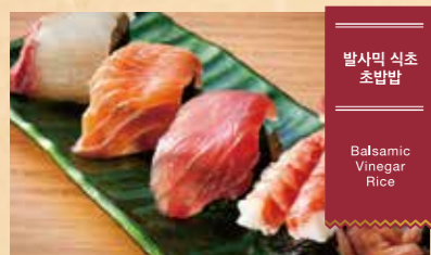
발사믹 식초 초밥밥 Balsamic Vinegar Rice

56 참치의 감칠맛과 마스카포네의 진한 허머니 마스카포네와 참치 구이 덮밥 The Rich Harmony of Savory Tuna and Mascarpone Mascarpone & Grilled Tuna Rice Bowl ¥1,400