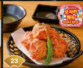
23 말랑말랑 다코야키 튀김 붉은 초생강 함유 Soft and Fluffy Takoyaki Tempura with Batter Containing Red Pickled Ginger ¥600