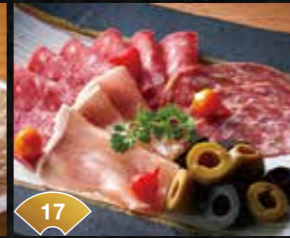
17 술과 찰떡궁합 살라미와 올리브 Goes Great with Alcohol Salami and Olives ¥500