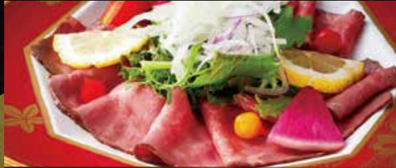
03 일본산 소고기 사용 저온 조리로 촉촉한 육즙 로스트 비프 샐러드 Cooked at Low Heat to be Moist and Juicy Roast Beef Salad ¥1,000