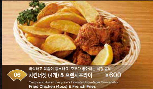
06 바삭하고 육즙이 풍부해요! 모두가 좋아하는 최강 콤비 치킨너겟 (4개) & 프렌치프라이 Crispy and Juicy! Everyone's Favorite Unbeatable Combination Fried Chicken (4pcs) & French Fries ¥600