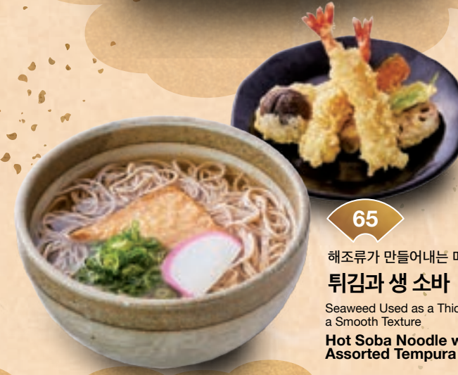
65 해조류가 만들어내는 매끄러운 식감 튀김과 생 소바 ¥1,600 Seaweed Used as a Thickener Creates a Smooth Texture Hot Soba Noodle with Assorted Tempura