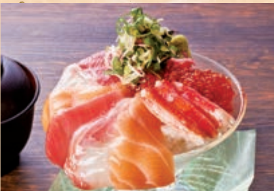
54 해산물을 듬뿍 담았습니다 호화로운 해물 덮밥 원장국 포함 ¥1,700 An Abundance of Seafood Special Seafood Rice Bowl (includes miso soup)