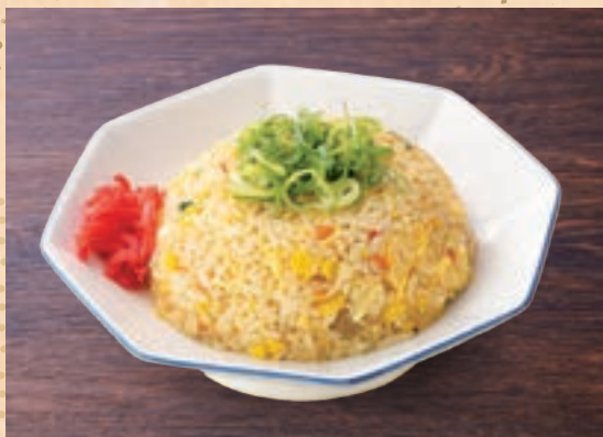
61 차슈의 감칠맛 가득 볶음밥 ¥600 Filled with the Deliciousness of Pork Slices Fried Rice