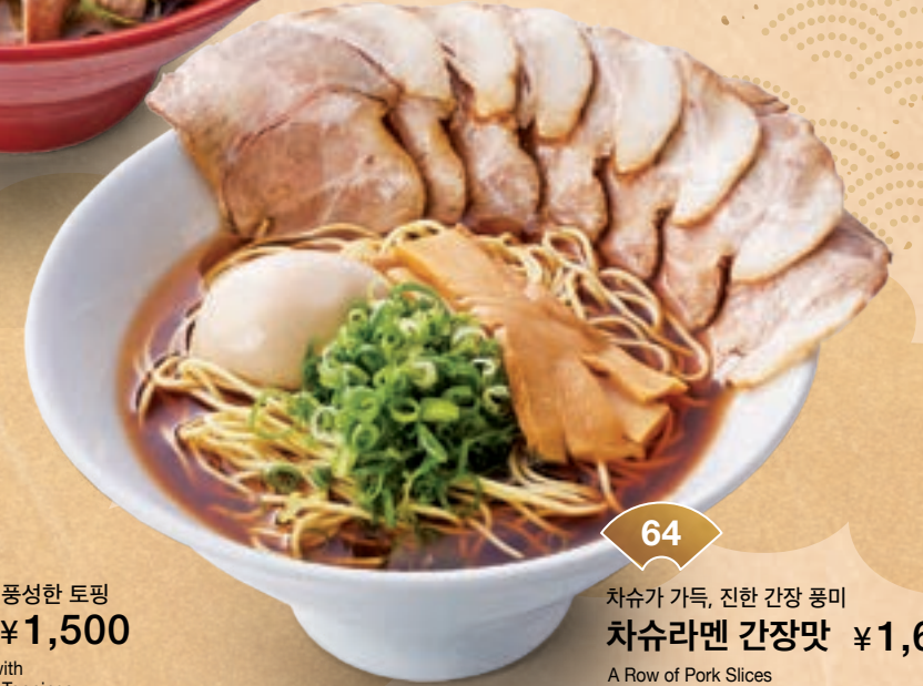
64 차슈가 가득, 진한 간장 풍미 차슈라멘 간장맛 ¥1,600 A Row of Pork Slices together with a Rich Soy Sauce Flavor Soy Sauce Ramen with Pork Slices