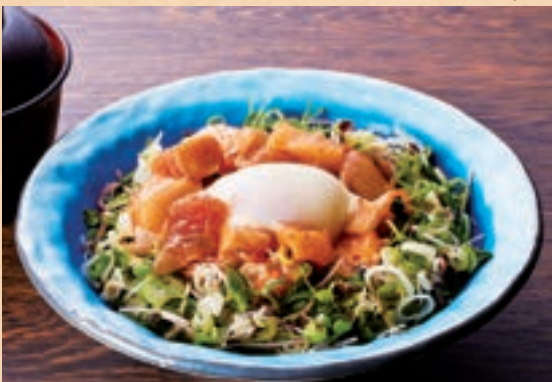
53 매콤한 조화의 맛 해산물 육회덮밥 원장국 포함 ¥1,800 A Harmonious Blend of Savory and Spicy Seafood Yukhoe Rice Bowl (includes miso soup)