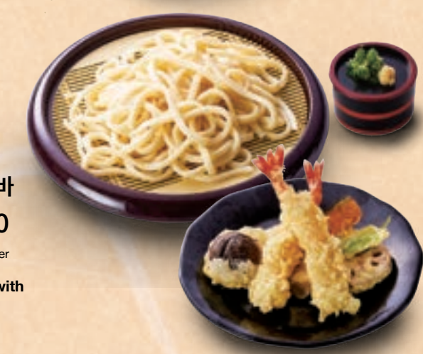
68 탄력이 있고 쫄깃한 식감의 사누키 우동 튀김과 사누키 자루우동 ¥1,600 Firm and Chewy Sanuki Udon Noodles Chilled Udon Noodle with Assorted Tempura