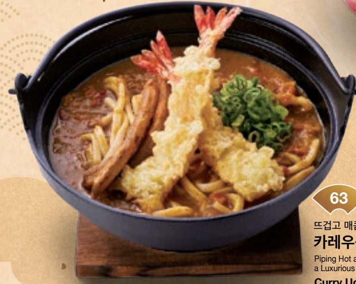
63 뜨겁고 매콤한 맛에 풍성한 토픽 카레우동 ¥1,500 Piping Hot and Spicy with a Luxurious Amount of Toppings Curry Udon