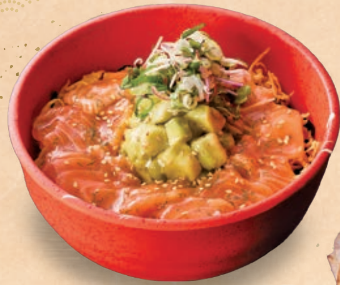
50 신선한 연어, 입에서 살살 녹는다 연어 아보카도 덮밥 원장국 포함 ¥1,500 Fresh Norwegian Salmon, melts in your mouth Salmon and Avocado Rice Bowl (includes miso soup)