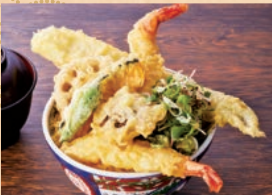
59 봉장이 1개, 새우 2개, 계절야채 최고급 튀김 덮밥 원장국 포함 ¥1,800 1 Conger Eel, 2 Prawns, and Seasonal Vegetables Exquisite Tempura Rice Bowl (includes miso soup)