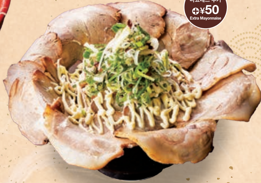
51 밥이 보이지 않을 만큼 푸짐한 차슈 마요네즈가 포인트인 차슈덮밥 원장국 포함 ¥1,500 So Many Pork Slices, You Can't Even See the Rice Pork Slice Rice Bowl Perfected with Mayonnaise (includes miso soup)