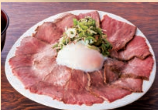
55 품질 좋은 살코기를 정성스럽게 마무리 로스트 비프 덮밥 원장국 포함 ¥1,800 Carefully Prepared with High-quality Lean Meat Roast Beef Rice Bowl (includes miso soup)