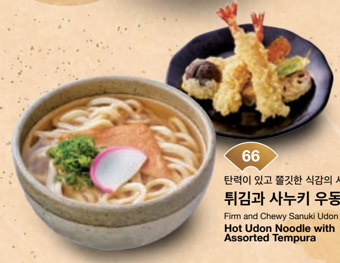
66 탄력이 있고 쫄깃한 식감의 사누키 우동 튀김과 사누키 우동 ¥1,600 Firm and Chewy Sanuki Udon Noodles Hot Udon Noodle with Assorted Tempura