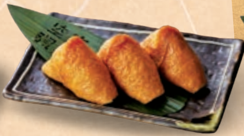
57 유부에 양념이 배어든 부드러운 맛 유부초밥 ¥500 Deep Fried Tofu Infused with a Gentle Flavor Inari Sushi