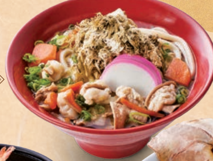
오사카 메뉴 62 고소함과 감칠맛이 어우러지는 오사카의 맛 오사카 곱창 우동 ¥1,400 A Blend of Aroma and Richness – The Taste of Osaka Osaka Offal Udon