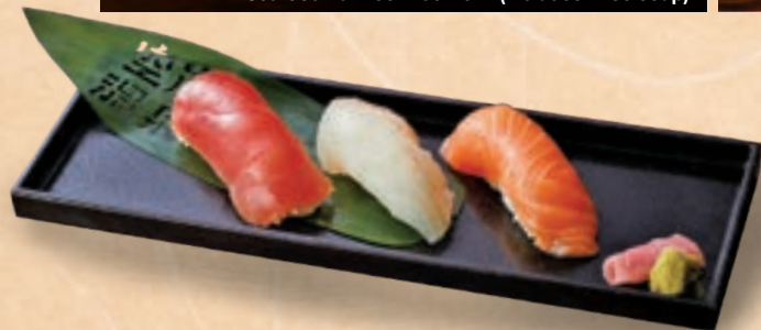
56 제철의 맛을 한 입씩 모듬 초밥 3점 세트 ¥600 Seasonal Delicacies, One Bite at a Time Three-Piece Hand-Pressed Sushi Set