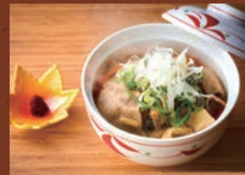
29 육수와 재료의 감칠맛이 녹아든 훈훈한 한 그릇 건더기가 듬뿍 돈지루 (생사치미 포함) ¥400 A Heart-warming Dish Blending Soup Stock and the Flavor of the Ingredients Hearty Pork and Miso Stew (with Fresh Seasonings)