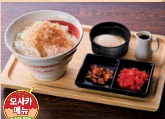
오사카 메뉴 50 마늘칩과 홍생강으로 맛 변신 혼제 간장으로 즐기는 오사카식 계란밥 Change the flavor with garlic chips & red pickled ginger Osaka-Style Egg Rice with Smoked Soy Sauce ¥700