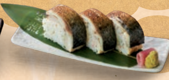
58 생강이 고등어의 감칠맛을 깔끔하게 살려주는 맛 고등어초절임 봉초밥 ¥600 The Rich Flavor of Mackerel Highlighted by Ginger Vinegared Mackerel Rolled Sushi Log