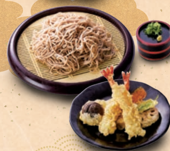
67 해조류가 만들어내는 매끄러운 식감 튀김과 생 자루소바 ¥1,600 Seaweed Used as a Thickener Creates a Smooth Texture Chilled Soba Noodle with Assorted Tempura